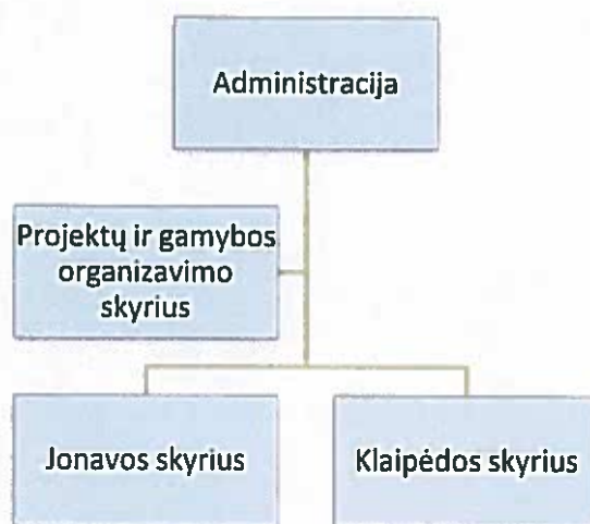
UAB „GVT LT“ organizacinės valdymo struktūros schema

Pagrindiniai bendrovės valdymo organai yra visuotinis akcininkų susirinkimas (savininkas) ir direktorius (bendrovės vadovas).